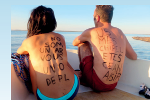
Sud The Georges Tremblay Show Performance

L'artiste propose une carte illustrée de sa libre interprétation du territoire. Elle révèle les ambiances, les pépites et les usages anciens et futurs de la vallée de la Têt.