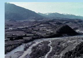
Mémoires de la Têt Institut Jean Vigo Projection de films d'archives amateurs

L'artiste, adepte des projections grandeur nature, mettra en scène des séquences sélectionnées et interprétées montrant les différents visages du fleuve et de ses berges.